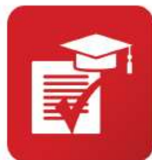
Календарь ввода обучения по новому ФГОС ООО