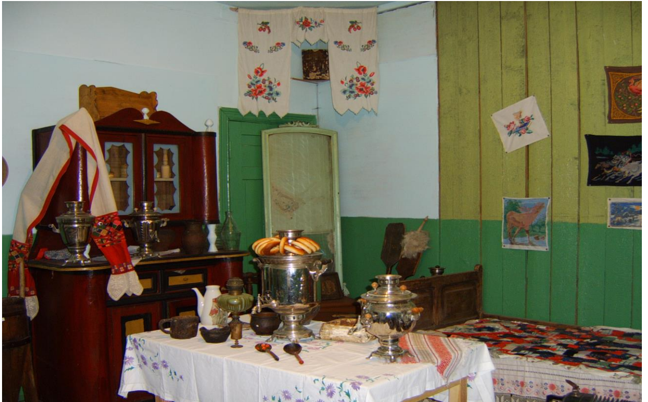
Школьный краеведческий музей