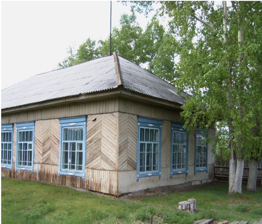
Здание конторы, принадлежащее ООО «Авангард»