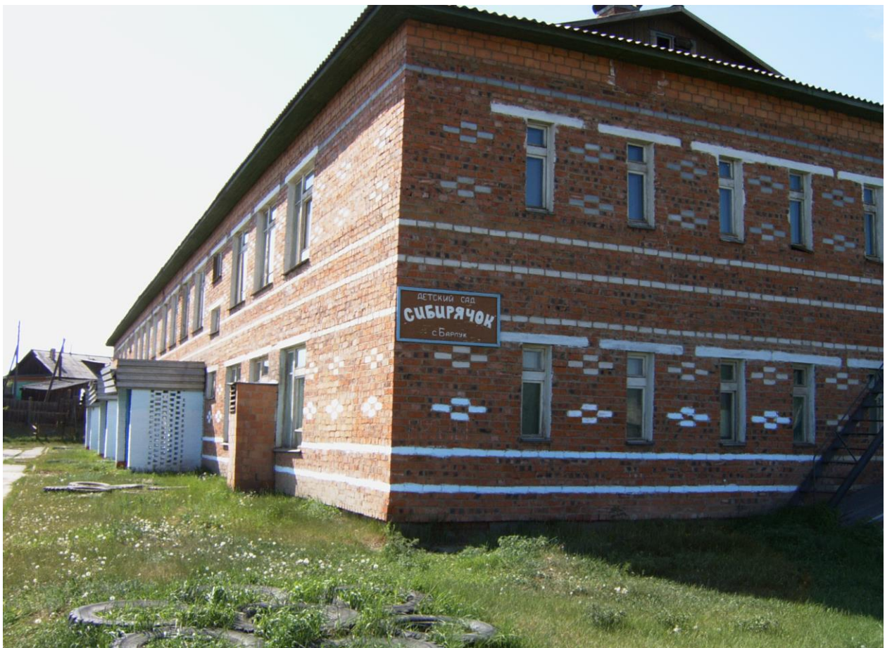
Детский сад «Сибирячек»