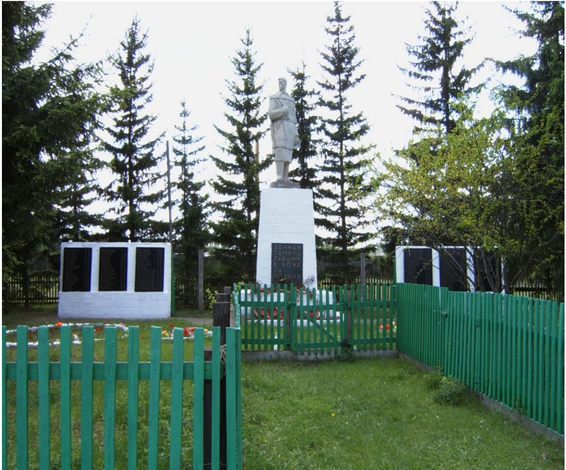
Памятник погибшим барлучанам