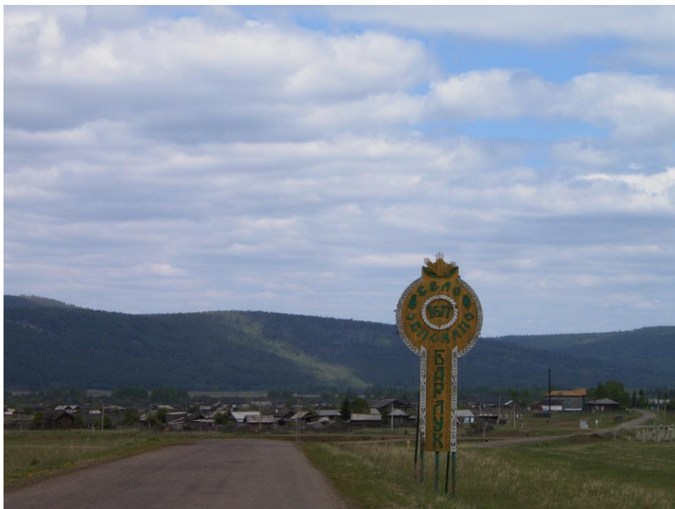
Стела, выполненна я при въезде в село Дягелевым Артемом