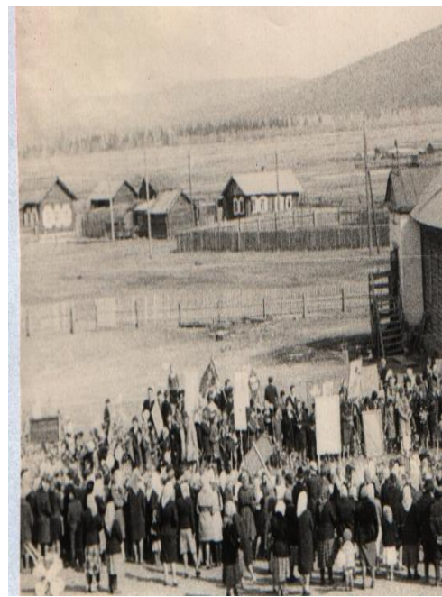
Открытие памятника 9 мая 1965г.