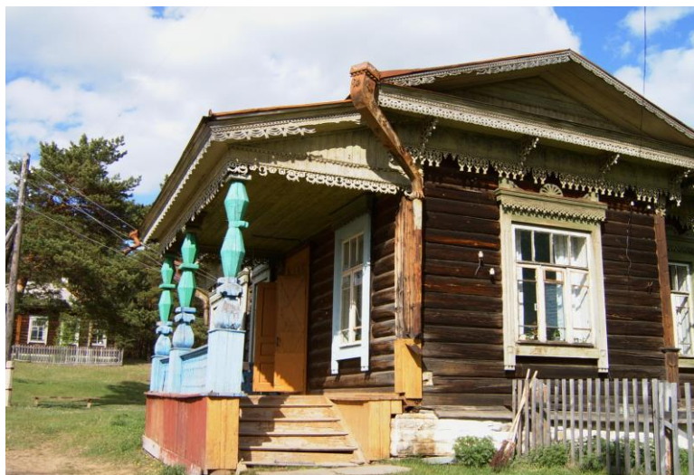
Больница с резными кружевами