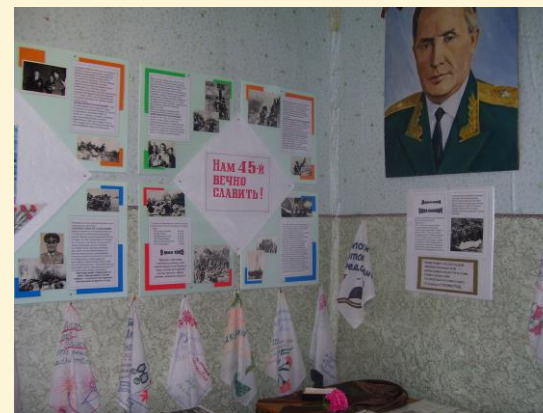
«Комната боевой Славы»