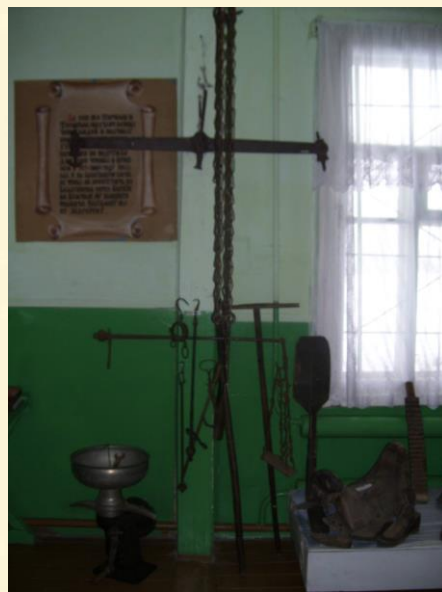
«Быт и ремёсла крестьян XIX-XX веков»